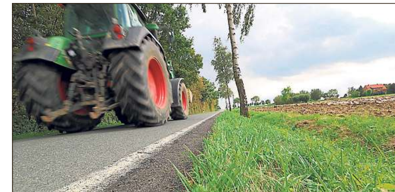
Die Verantwortung über die Wirtschaftswege auf Oelder Gebiet soll nach dem Willen von Stadt und Politik künftig ein Verband übernehmen, den die Anlieger gründen müssten.

Darüber hinaus hat die Stadt jetzt mitgeteilt, dass sie die Einrichtung des Verbands beim Kreis Warendorf als Aufsichtsbehörde beantragt hat. Der Kreis werde nun die erforderlichen organisatorischen Schritte für das weitere Verfahren einleiten. An dessen Ende stehe die formale Verbandsgründung durch die Anlieger, die anschließend Beiträge leisten werden. An der Unterhaltung der Wege und Bankette beteiligt sich die Stadt mit der Sockelfinanzierung sowie der Einbindung des Baubetriebshofs zur Unterhaltung der Nebenanlagen.